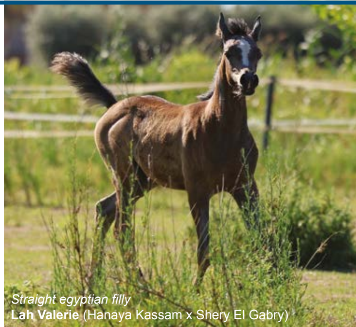
Straight egyptian filly Lah Valerie (Hanaya Kassam x Shery El Gabry)

ne equina, ho deciso con mio padre di incrementare il lato allevatorio della nostra passione. Abbiamo avviato la stazione di monta ed abbiamo cominciato ad inserire nel nostro programma allevatorio le linee egiziane, che riteniamo essenziali per creare un buon pool genetico che si esprima nella realizzazione di un cavallo completo. Produciamo dai tre ai sei puledri all'anno destinati al mercato allevatorio nazionale e internazionale.