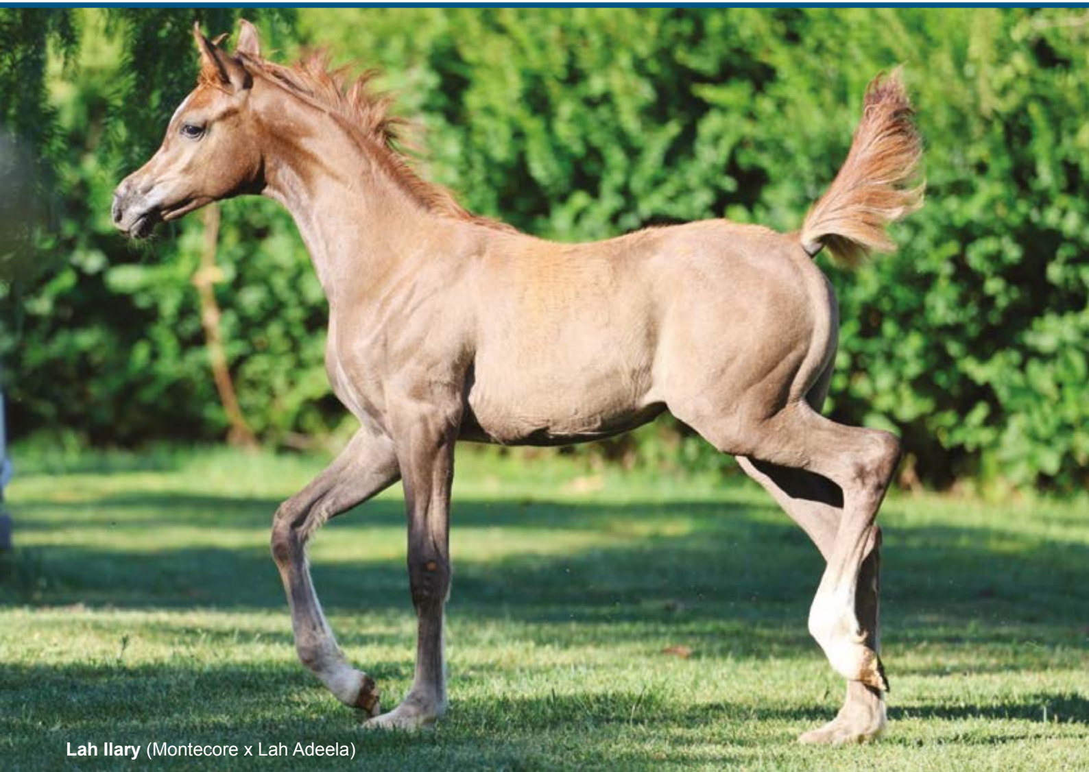
Lah Ilary (Montecore x Lah Adeela)

nel movimento leggero e armonico la sua funzionalità e divertimento e, nel rapporto con l'uomo, un insostituibile riferimento. Non necessariamente deve avere un dish estremo, ma i nostri puledri devono complessivamente essere di un buon tipo e possedere un movimento carismatico. Il cavallo arabo, per noi, deve rimanere quell'animale capace di affrontare il deserto e uscirne vincitore.