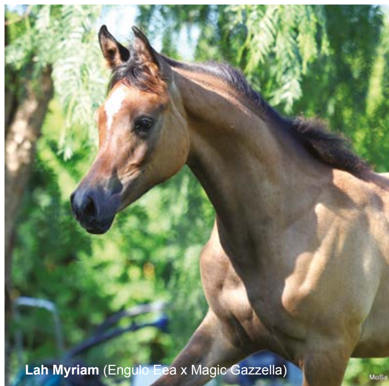
Lah Myriam (Engulo Eea x Magic Gazzella)

Miriam ad allevare un cavallo riconoscibile ed equilibrato, con arti forti, fronti larghe e grandi occhi, che trova