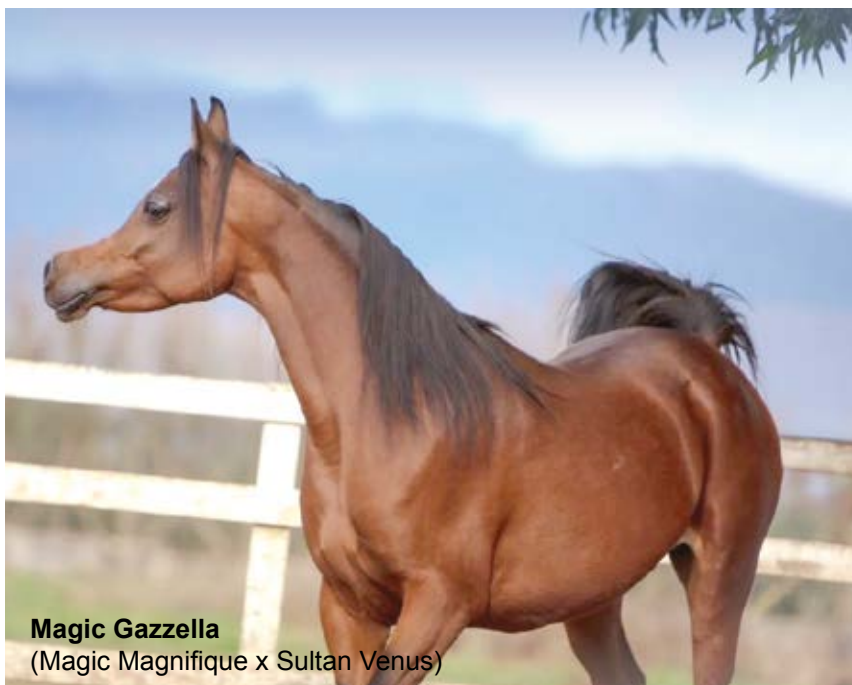
Magic Gazzella (Magic Magnifique x Sultan Venus)