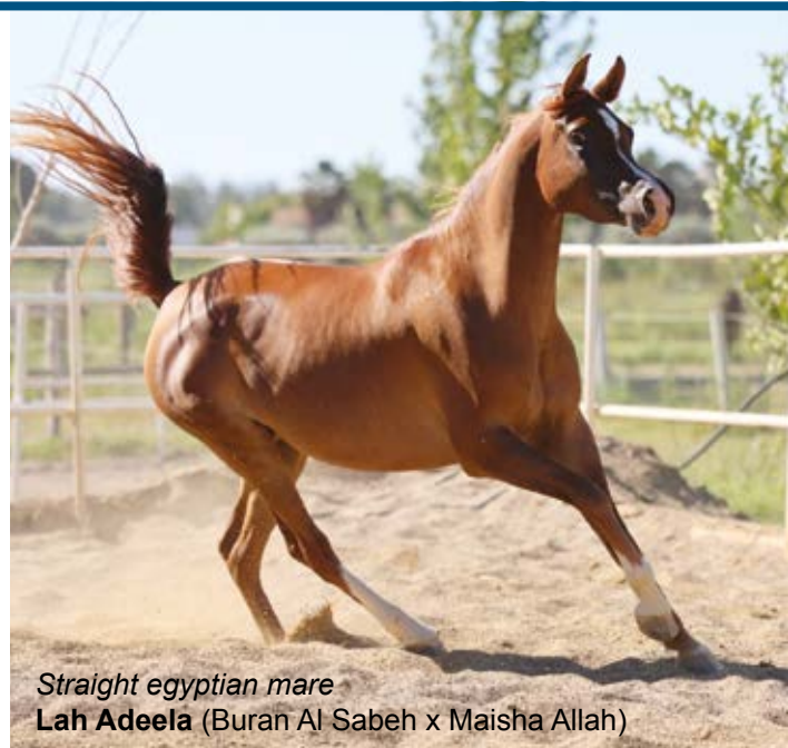
Straight egyptian mare Lah Adeela (Buran Al Sabeh x Maisha Allah)