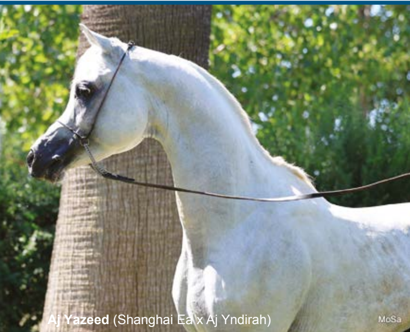
Aj Yazeed (Shanghai Ea x Aj Yndirah)