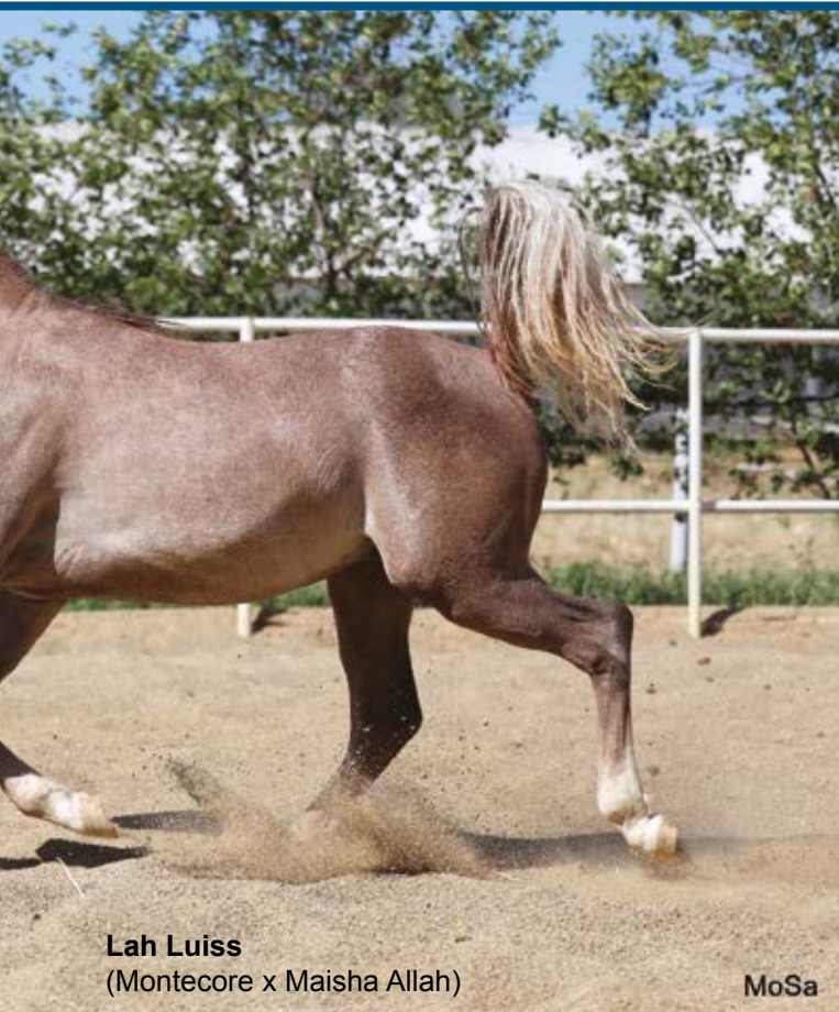
Lah Luiss (Montecore x Maisha Allah)